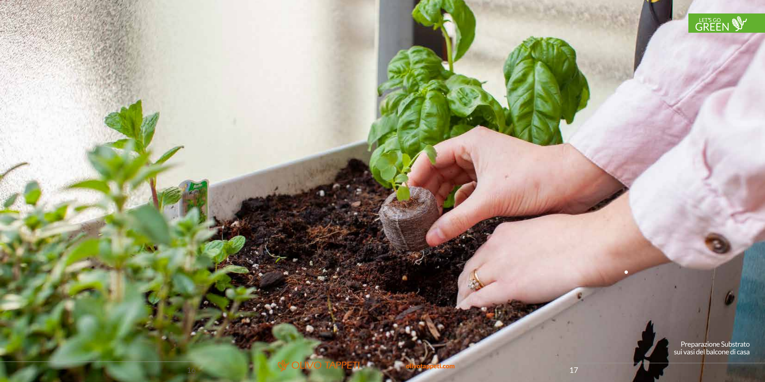
Preparazione Substrato sui vasi del balcone di casa