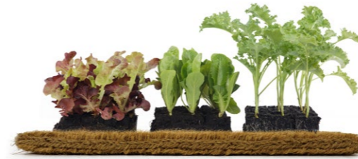
Premiati per lo zerbino Re-Birth. Fiera Ambiente, Francoforte 2023. Awarded for the Re-Birth doormat. Ambiente Fair, Frankfurt 2023.