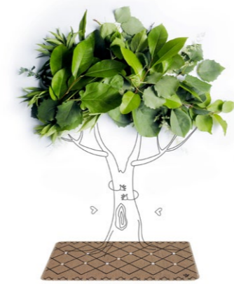
Premiati e selezionati per il tappeto Marrakech. Fiera Ambiente, Francoforte 2022. Fiera Homi Milano 2022. Selected and awarded for the Marrakech rug. Ambiente fair, Frankfurt 2023. Homi fair, Milano 2022